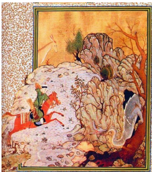
Рис. 2. Камалиддин Бехзод. «Бой Бахрома Гора с драконом». Миниатюра Низами "Хамса" XV век

В другой его работе, «Хайратул аброр» Алишера Навои (23x16 см, бумага темпера, 2013 г.), мы видим, что композиция находится в традиционном статичном состоянии. Работа визуально разделена на две части: в центре верхней части вид на правящее крыльцо и окружающий сад, в верхней части небольшие облака, в левой части тихий пейзаж в виде зонтичного ковра. В нижней части работы персонажи запечатлены в светло-розовом мраморном дворе. Нижняя часть работы квадратная, а люди расположены симметрично по кругу. В центре нижней композиции изображается правитель на ковре, приведенная к нему пожелая женщина, дворцовые придворные и стражники, расположенные пропорционально по форме круга с обеих сторон. Чтобы привлечь внимание к основному содержанию, автор изображает в центре бассейн с пересекающимися его каналами в форме креста. Внутри бассейна композиция из двух плавающих уток, которые символизируют на востоке земных и небесных созданий. В решение этой композиции ярко просматривается работа в стиле бухарской школы миниатюры похожая на миниатюру из произведении Саади «Гулистан» «Хан в окружении придворных и музыкантов, на крыльце в саду» (муракка) [7]. В данной работе присутствует просторное решение композиции, гармония тёплых красок и баланс теплых и холодных отношений, присущие бухарской школе миниатюры.