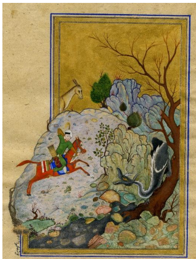
Рис. 1. Ш.Мухаммаджанов. «Битва Бахрома с драконом» Низами «Хамса» раз. 19x12 2010й темпера бумага

Ниже мы рассмотрим несколько его миниатюр, нарисованы с использованием натуральных пигментов и клеев, на шелковой бумаге которые были изготовлены самим автором. В его работе к «Хамсе» Низами «Битва Бахрома с драконом» (19x12 см, бумага 2010 г., темпера) композиция выстроена в традиционной вертикальной прямоугольной форме, характерной для миниатюр. При этом поверхность композиции визуально делится на три части, верхняя часть представляет собой символическое небо цвета золото, а нижние две трети состоит из земли и горных камней. Слева от центра работы мы видим Бахрома, который готовится стрелять из лука по дракону, а с правой стороны мы видим дракона, выходящего из пещеры и готовящегося атаковать его. Работа выполнена в стиле хората, традиций бухарской миниатюры, и мы видим, что ее композиционное решение заимствовано от великого художника Востока Камалиддина Бехзада.