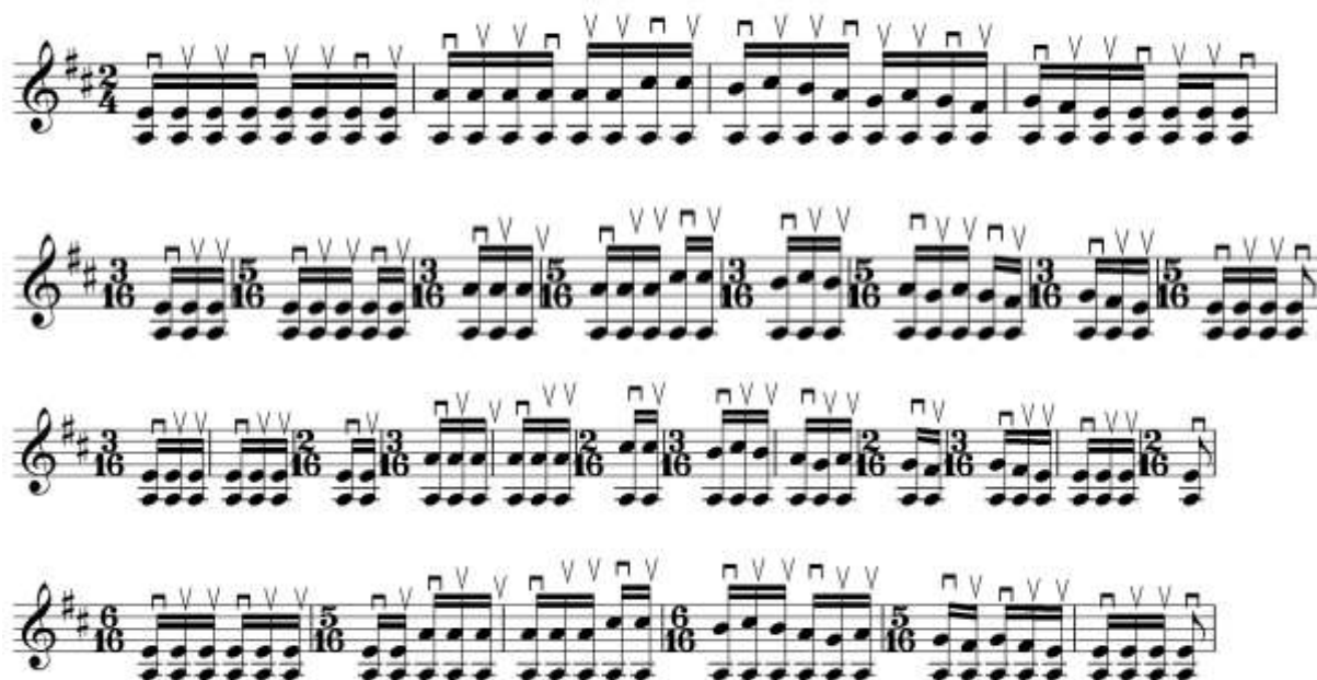
Рис. 2. Пример. Штрих тескари зарб

Ещё одна несинхронность связана с штрихом “Пирранг”. Фиксация этого штриха в 2/4 не совпадает с метром звучащей музыки. Приведем пример, который отражает совпадение между ударностью штриха и метра.