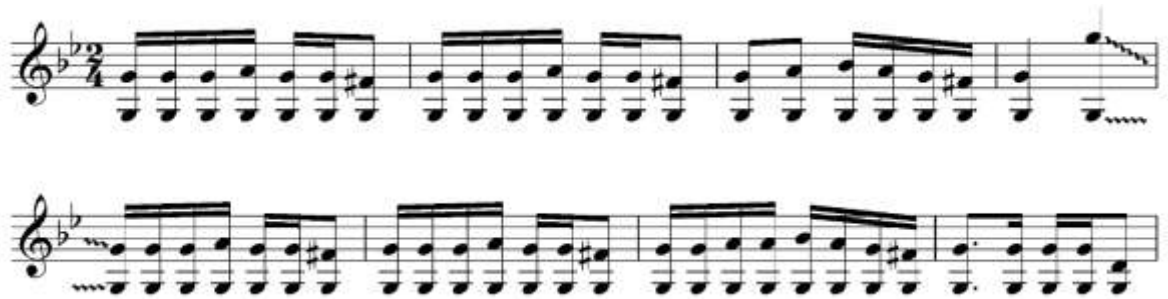
Рис. 5. Пример. Кунгил гулдастаси

В данной мелодии начальные два такта исполняются штрихом “тескари зарб”, а последующие третьи и четвертые простым штрихом. В 5,6 и 7-тактах также используются “тескари зарб”, 8-такте возвращаемся к простому штриху. В результате происходит колебание метра, то есть сначала метр излагается в виде 3/16+3/16+2/16 , а потом 2/4 .