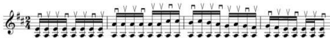
Рис. 1. Пример. Хайронинг бўлай

совпадения метра и зарба. Например, проанализируем 4 такта из узбекской народной мелодии “Хайронинг бўлай”, написанной в размере 2/4.