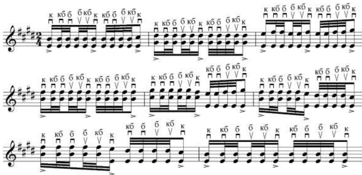
Рис. 4. Пример. Дилноз

В этой мелодии используются штрихи “тескари зарб” и “пирранг”, их ударность между собой одинаковы.