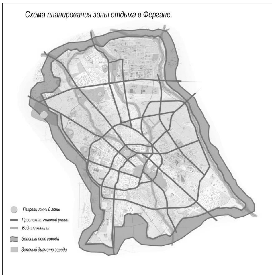
Рис. 3. Схема планирования зоны отдыха в Фергане

При определении структуры и потенциала медицинских учреждений и оздоровительных центров необходимо учитывать необходимость загородных зон отдыха, направлений развития, повышения туристической важности и семейного отдыха.