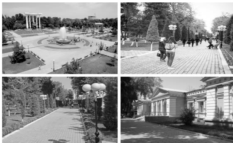
Рис. 1. Фотогалерея парка отдыха в центре города Ферганы

В процессе климатического анализа города Ферганы можно сделать вывод, что есть очень удобные места для рекреационных зон в самом городе и прилегающих районах. Стоит отметить, что климатические зоны в Республике Узбекистан состоят из 3 типов.