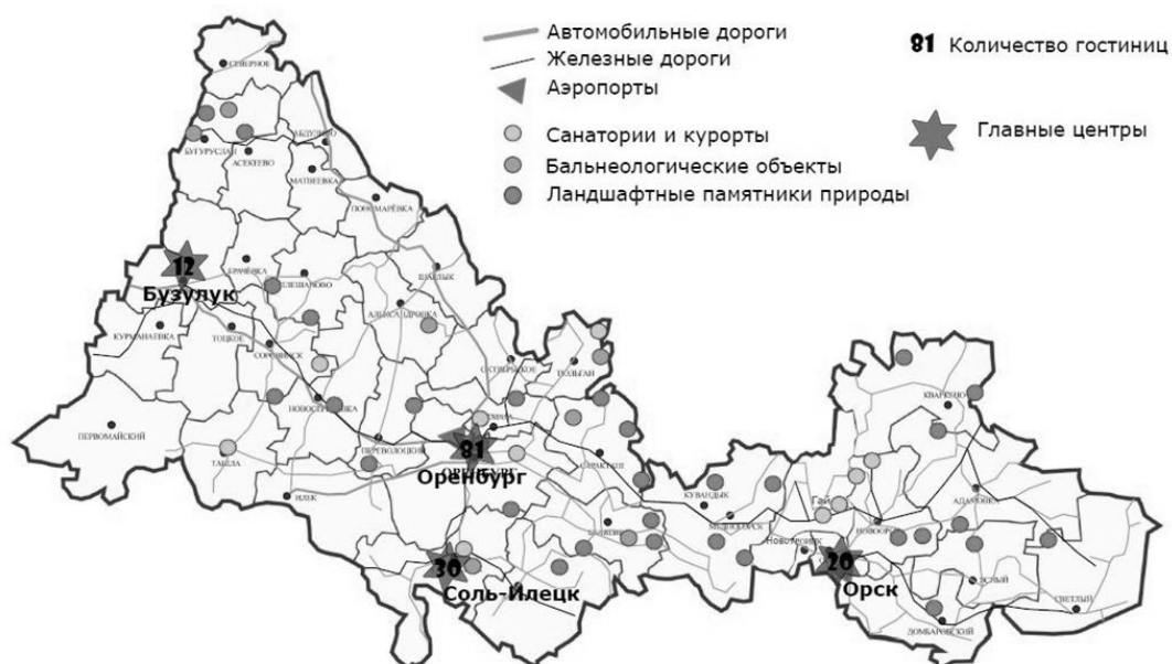
Рис. 2. Карта оценки развитости туристской инфраструктуры в крупнейших туристских центрах Оренбургской области

На основе сделанных выводов была составлена карта оценки районов по степени развитости туризма и рекреации.