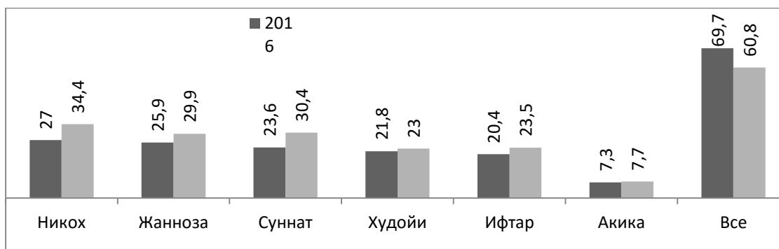
Рис. 1. Распределение ответов на вопрос: «Какие религиозные традиции, обряды и ритуалы совершались в 2014, 2016 гг. в Вашей семье?», %

В исламе существует специфическая обрядность, связанная с религиозными отправлениями и праздниками. Обряды и праздники составляют неотделимую часть и являются одним из главных атрибутов ислама, без которых нельзя представить эту религию. Для выявления степени соблюдения этих обрядов, обычаев, совершаемых в семье, респондентам был задан вопрос: «Какие религиозные и народные обряды и ритуалы совершаются в Вашей семье?» (рис. 1).