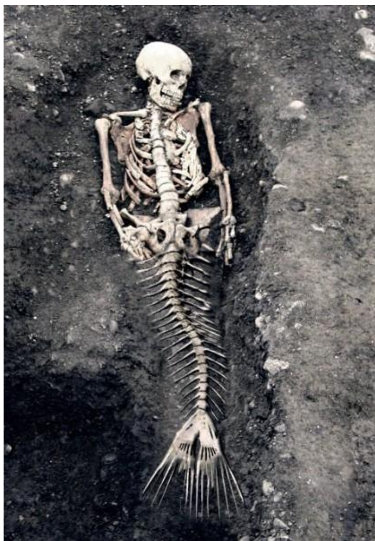
Рис. 1. Скелет человекорыбы, найденный в Египте

В Библии и сказаниях различных народов говорилось о человекозверях, человекоскотах, человекоптицах, человекорыбах, человекозмеях и т.п. Это были люди-демоны. Также создавались гибридные животные, управляемые духами ангелов.