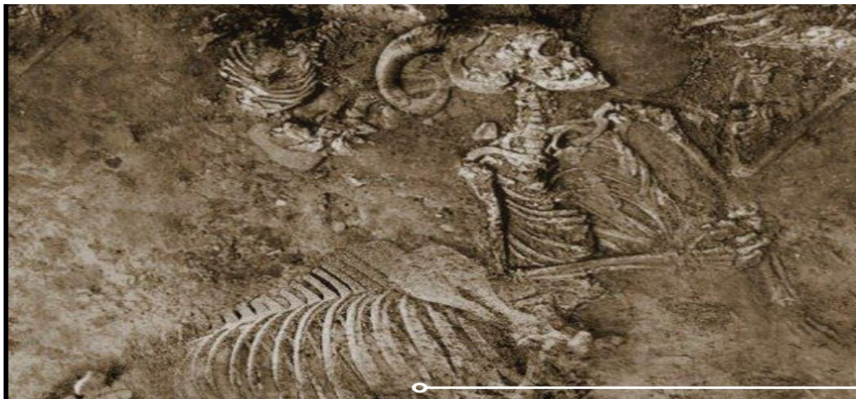
Рис. 2. Скелет человекоскота, найденный на Кипре