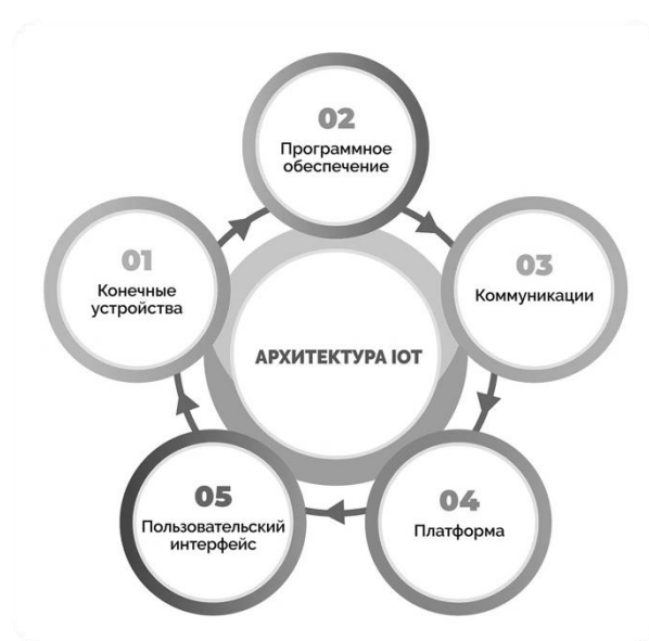
Рис. 2. Состав архитектуры Интернета вещей.

Технология Интернета вещей основывается на принципе соединения физических устройств с интернетом для сбора, обмена и анализа данных без необходимости прямого участия человека (рис. 2). Основой работы IoT являются сенсоры и датчики, установленные на устройствах, которые собирают различные данные о окружающей среде или самом устройстве [3]. Эти данные передаются через сеть Интернет на серверы для анализа и обработки. С помощью специальных программ и алгоритмов, эти данные могут быть интерпретированы, чтобы получить ценную информацию о состоянии устройства или окружающей среды.