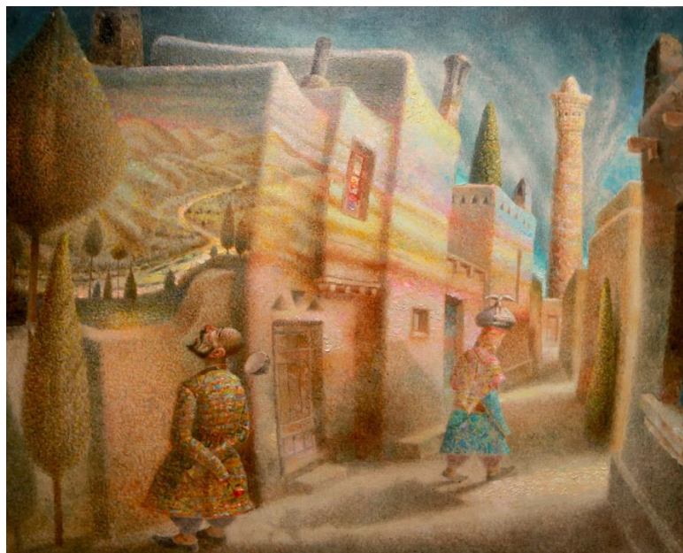
Рис. 1. «В гости», холст, масло.

Его живопись «драгоценна», она не ослепляет буйством красок, а наоборот, как бы гармонизирует их отношения. Каждая из его картин – свидетельство какой-то своей жизненной программы, своих идеалов и ценностей, своих корней и традиций (рис. 1). При всей кажущейся камерности его видение глобально, он обладает редким даром «мыслить симфонически», как говорил уникальный инженер В.Г. Шухов [6].