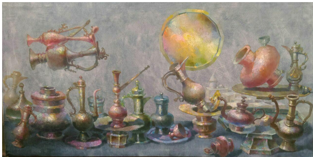
Рис. 4. «Медная мелодия», холст, масло.

Он принадлежит к числу тех художников, которые инстинктивно устремляются к глубинным народным традициям в решении важнейших философско-поэтических вопросов времени. Объединить новизну порожденных эпохой образов и художественное наследие прошлого остается для этого художника одной из самых главных творческих задач.