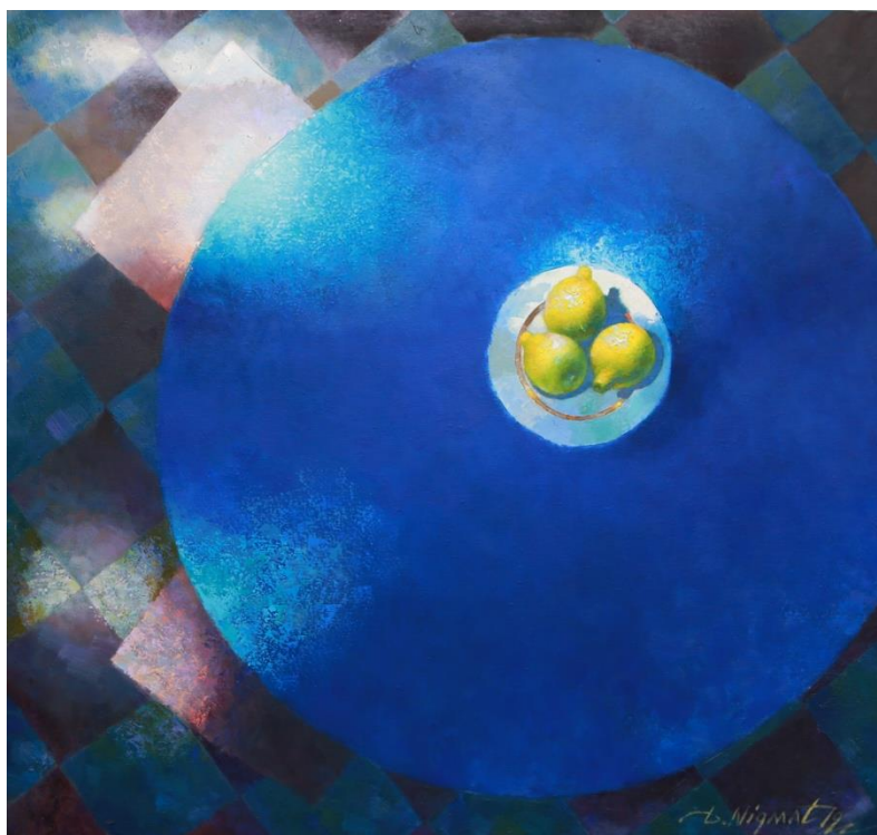
Рис. 3. «Натюрморт с лимонами», холст, масло.

составляет поэтика куда более давних времен, чем пора его собственной жизни, и эта поэтика остается постоянной величиной его творчества. Для его художественно-философского формирования было много импульсов, и одним из важнейших является лиричность и некая философичная отстраненность, присущая мастерам старой Европы.