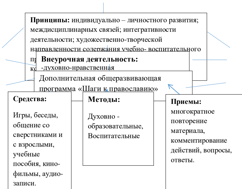
Рис. 1. Педагогическая модель духовно-нравственного воспитания младших школьников в процессе знакомства с православной музыкой

Работа по духовно-нравственному воспитанию младших школьников построена с учетом их возрастных особенностей. Внутри каждой темы раскрывается смысл основных содержательных линий, присутствующих во всей программе: «Знакомство с Библией», «Как изобразить доброе и красивое», «Рождество Христово», «Пасха», «Православные святые», «Православные традиции и семейные ценности».