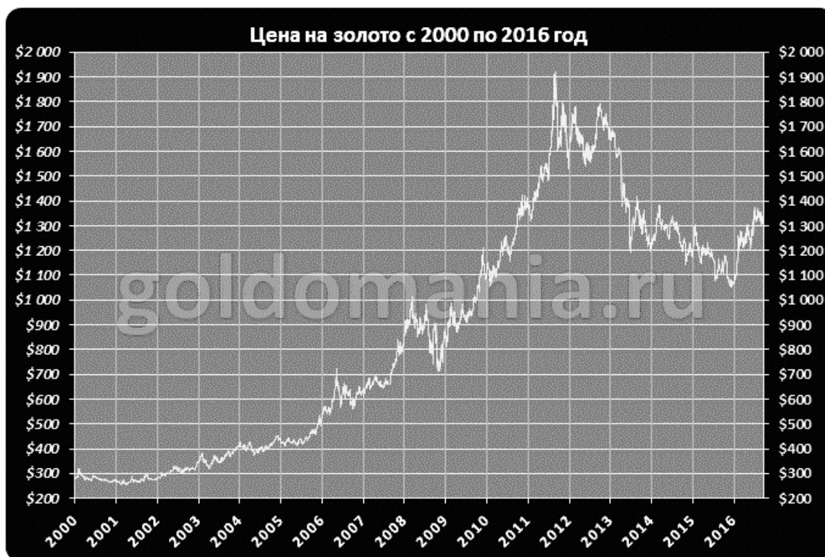
Рис. 2. Мировая цена на золото с 2000 года по 2016 год

По графику, изображенному на рисунке 2, можно наблюдать положительную динамику цены на золото начиная с 2000 года [6, www.goldomania.ru/ (дата обращения 25.09.2016)].