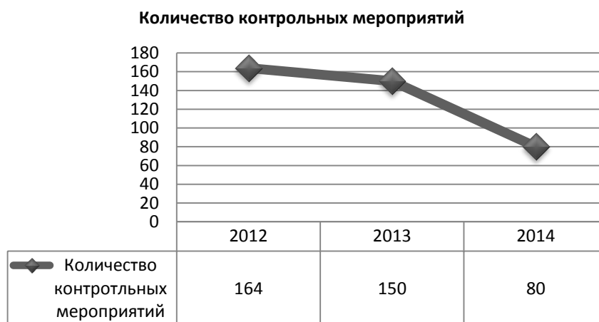
Рис. 1. Общее количество контрольных мероприятий, проведенных ТУ Росфиннадзора в Орловской области за 2012-2014 годы

Из данных рисунка 1 заметно ежегодное снижение количества контрольных мероприятий, проводимых ТУ Росфиннадзора в Орловской области, что связано с уменьшением количества назначенных Службой ТУ Росфиннадзора централизованных заданий, а также снижением численности штата ревизоров в динамике трех лет на 16%. Снижение количества проводимых контрольных мероприятий за период с 2012 по 2014 годы также связано с изменениями полномочий Росфиннадзора в отношении автономных и бюджетных учреждений, которые не являются получателями средств федерального бюджета. Проверки в таких организациях проводились лишь в случае получения межбюджетных трансфертов из федерального бюджета.